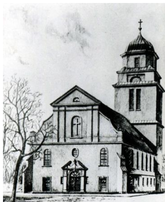
Ev. Kirche in Soldau 1930 (nach dem Wiederaufbau)

Wir wollen einen Beitrag zum Abbau von Vorurteilen und zum Aufbau gutnachbarlicher und freundschaftlicher Beziehungen zwischen Deutschen und Polen leisten.