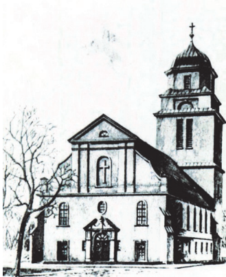
Ev. Kirche in Soldau 1930 (nach dem Wiederaufbau)

Wir wollen einen Beitrag zum Abbau von Vorurteilen und zum Aufbau gutnachbarlicher und freundschaftlicher Beziehungen zwischen Deutschen und Polen leisten.